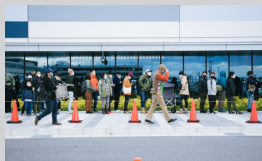
ソーシャルディスタンス