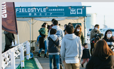
出入口サーモカメラ(検温)・入退場管理