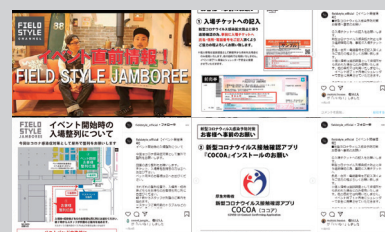
SNSを使用した事前の注意喚起など

チケット完全前売制、入口での検温と入退場管理、マスクの着用義務、手指消毒やソーシャルディスタンス協力をお願い、動線拡幅、場内換気、また、混雑状況や事前注意喚起の配信などを行い、来場の皆様にご理解とご協力頂き、安全に運営・閉幕することができました。