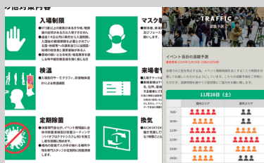
混雑状況の配信と対策方法の開示